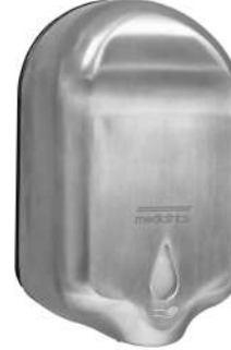
DJ0050ACS Acabado satinado