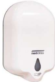
DJ0050A Acabado blanco